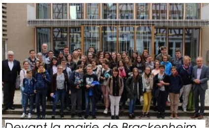
Devant la mairie de Brackenheim

Après une réception officielle de bienvenue par le Maire de Brackenheim, nos élèves suivent les cours avec leurs correspondants, et participent à de nombreuses activités (visites de musées, des villes voisines, ... )