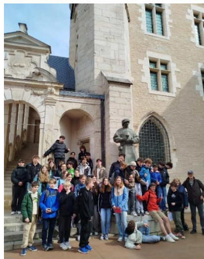
2025-Visite de Dijon

Pendant leur semaine française, les jeunes de Brackenheim suivent une partie des cours avec leurs correspondants français et participent à des activités en collaboration avec des associations charnaysiennes ou mâconnaises (Tir à l'arc, golf, pétanque, laser game..), le mercredi une grande sortie est réalisée avec leurs amis français (La privatisation du Parc des Combes du Creusot pour notre groupe est particulièrement appréciée !) et le dernier jour du séjour une soirée est organisée avec la participation des parents français.